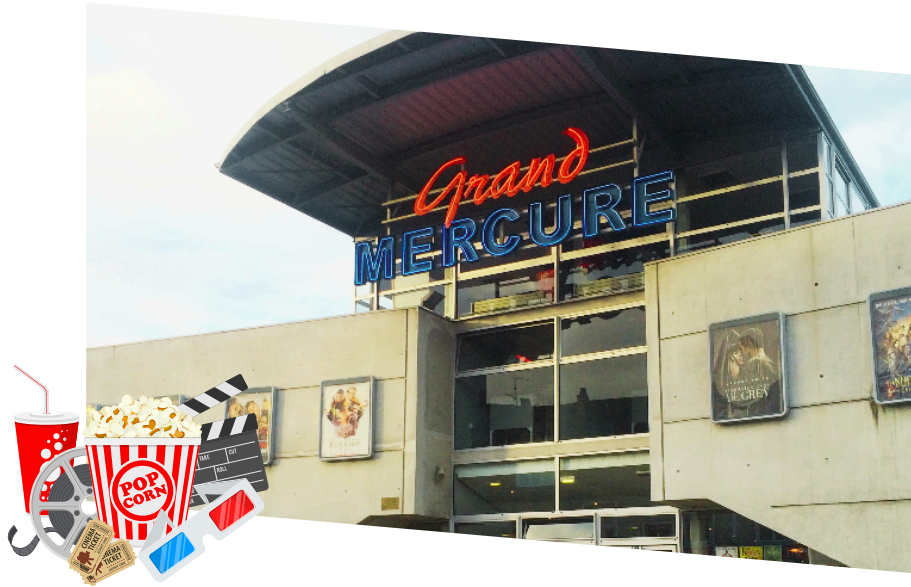
Le Cinéma Mercure