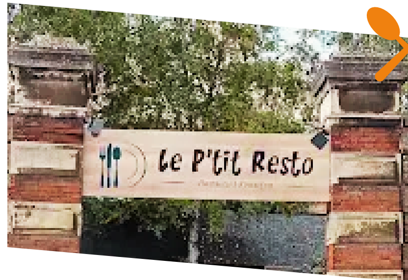
Le P'tit resto (ONM)

02 32 96 80 70 📍 19 rue Stalingrad 76500 ELBEUF