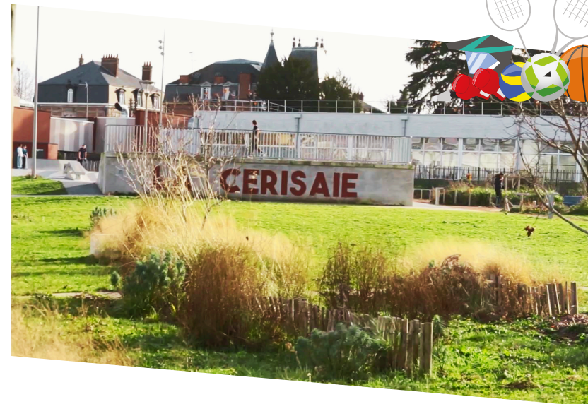
Complexe municipal de la Cerisaie

02 32 13 10 49 📍 2 rue Augustin Henry 76500 ELBEUF