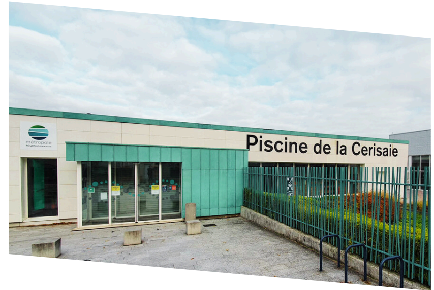
Piscine de la Cerisaie

02 35 78 92 95 35 rue de Roanne 76500 ELBEUF