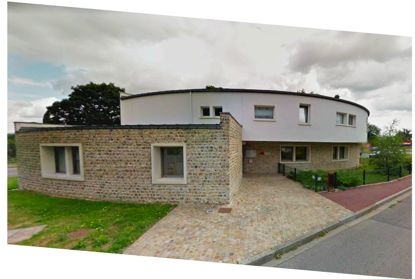
CMS : Centre Médico-Social

📍 Square Raoul Grimoin Sanson 76500 ELBEUF