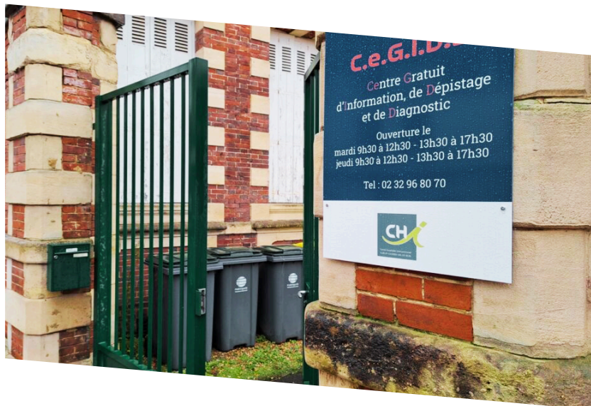
Le CeGIDD (2ème étage par l'ascenseur)