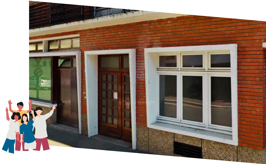
PAEJ Point Accueil Ecoute Jeunes